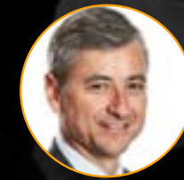
Jean-Philippe Courtois Président de Microsoft International Fondateur Live for good